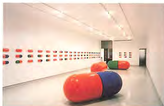
Red (Cadmium) Pla©ebo, 1991

Für ihre jüngste Retrospektive Fin de siècle im Württembergischen Kunstverein schuf die Gruppe zwei neue Arbeiten. One Year of Azt präsentierte 1.825 Azt-Tabletten, die die Wände einer großen Galerie vollständig bedeckten. Azt ist das wichtigste zur Aids-Behandlung verwendete Medikament und 1.825 Tabletten sind eine Standard-Jahresdosis. One Day of Azt bestand aus fünf freistehenden Skulpturen, jede zwei Meter lang, ebenfalls Nachbildungen der Azt-Kapsel, weiß mit einem blauen Streifen. Ihr neuestes Selbstportrait Playing Doctor zeigt die drei Künstler in Ärztekitteln, wie sie einander die Herzen abhören, umgeben von schwebenden Pillen in dem allwiederkehrenden Rot, Grün und Blau. Für diese neueste Serie von Arbeiten griff GENERAL IDEA auf die Form der Pillenkapsel zurück, allerdings mit einem Unterschied: die Pillen sind nun aus reflektierendem Mylar und mit Helium gefüllt, so daß sie, wie bei Playing Doctor , über den Köpfen schweben.